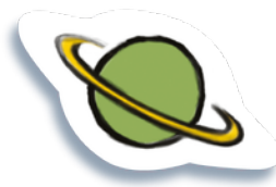
Imagem de um sistema solar bebê